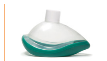
ClearLite™ anestesi-mask, storlek 4