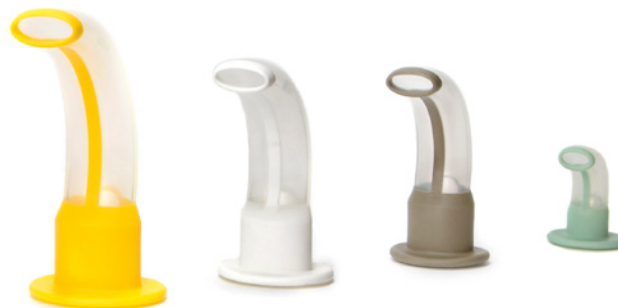
ISO storlek 9.0 ISO storlek 7.0 ISO storlek 6.5 ISO storlek 3.5

Varje avdelning behöver bestämma lokalt hur denna förändring ska genomföras, eftersom en utfasningsperiod av befintliga lagermängder kommer att ta vid.